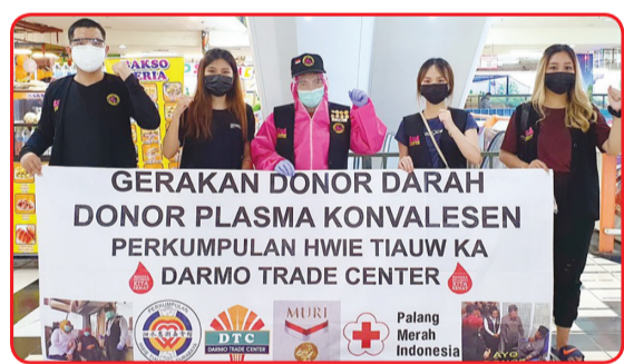
Kegiatan donor darah di Darmo Trade Center.