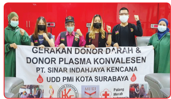
Kegiatan donor darah di UDD PMI Kota Surabaya.