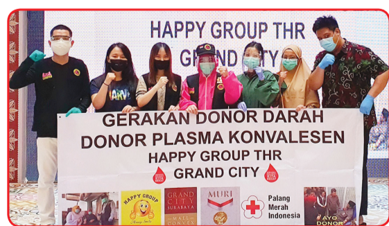
Kegiatan donor darah di Grand City Mall.