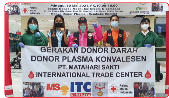
Kegiatan donor darah di International Trade Center.