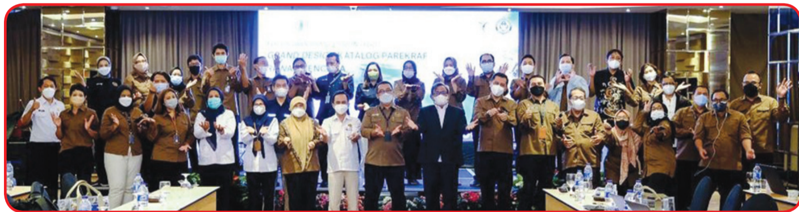
Foto bersama para pembicara dan peserta FGD.

"Kami juga menyiapkan web untuk perkiraan cuaca, di web tersebut bisa dilinkkan dengan katalog yang akan dibuat oleh Kemenparekraf, jadi akan jauh lebih lengkap," ujarnya. • bam