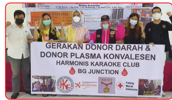
Kegiatan donor darah di BG Junction.