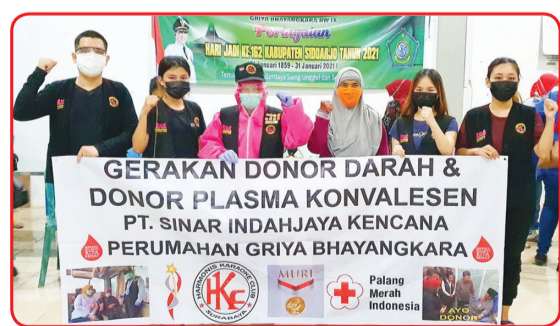
Kegiatan donor darah di Perumahan Griya Bhayangkara.