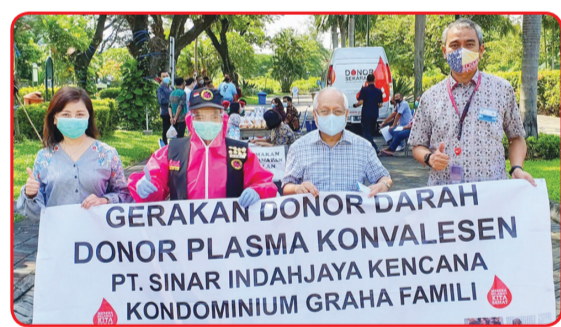
Kegiatan donor darah di Kondominium Graha Family Surabaya.