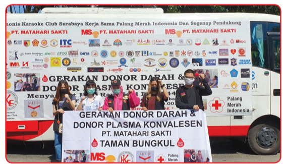
Kegiatan donor darah di Taman Bungkul.