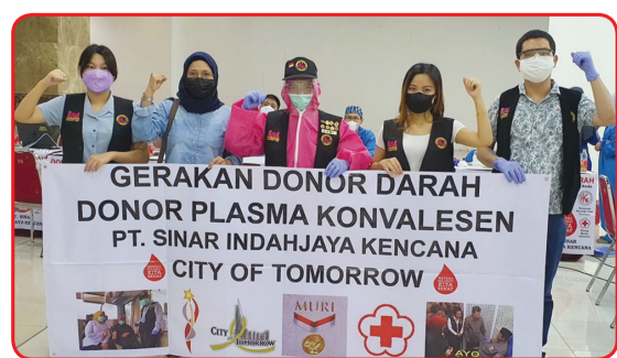
Kegiatan donor darah di City of Tomorrow Mall.