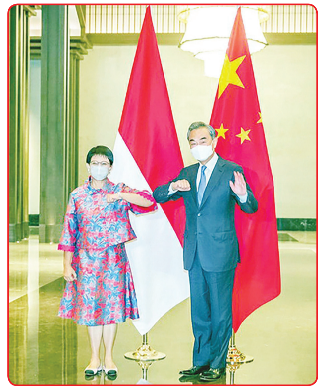
Menu Tiongkok Wang Yi dan Menu RI Retno Marsudi.

Kedua belah pihak juga saling bertukar pendapat secara mendalam mengenai masalah internasional dan regional yang menjadi perhatian bersama. • idn/din