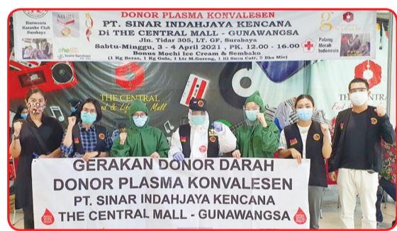
Kegiatan donor darah di Central Mall Gunawangsa Surabaya.