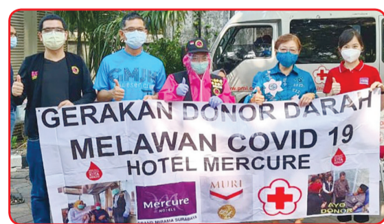
Kegiatan donor darah di Hotel Mercure Darmo Surabaya.