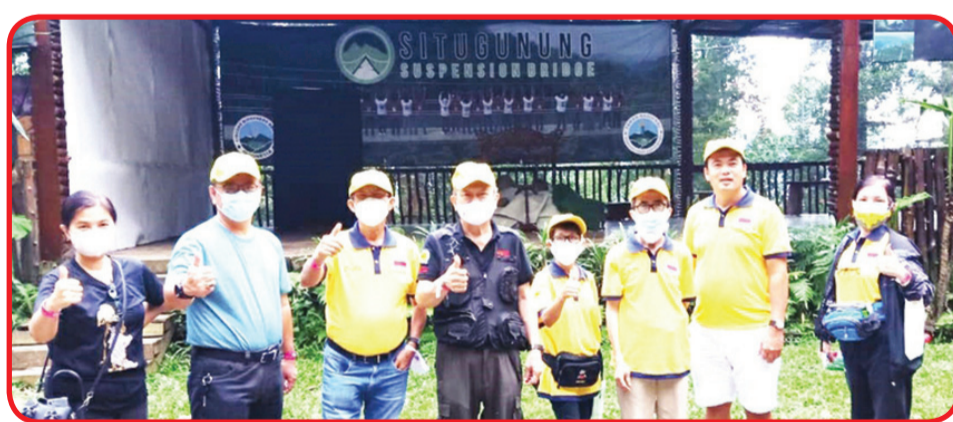
FOTO BERSAMA: Rombongan pengurus dan anggota Perkumpulan Marga Wu Indonesia berfoto bersama di Jembatan Gantung Situgunung Taman Nasional Gunung Gede Pangrango.

gota perkumpulan Sabtu (5/6) lalu menyelenggarakan Go-Touring Escape From Corona. Dalam kegiatan tersebut,