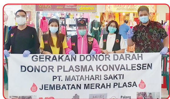
Kegiatan donor darah di Jembatan Merah Plaza.

Karena setetes darah yang disumbangkan membantu nyawa orang lain," imbuhnya.