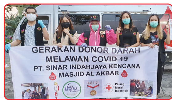
Kegiatan donor darah di Masjid Al Akbar.