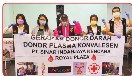
Kegiatan donor darah di Royal Plaza Surabaya.