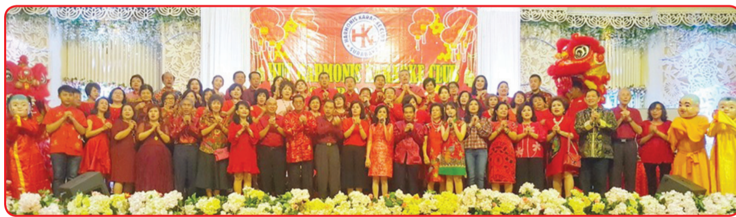
Harmonis Karaoke Club Surabaya.