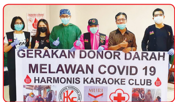
Kegiatan donor darah di Atom Mall.